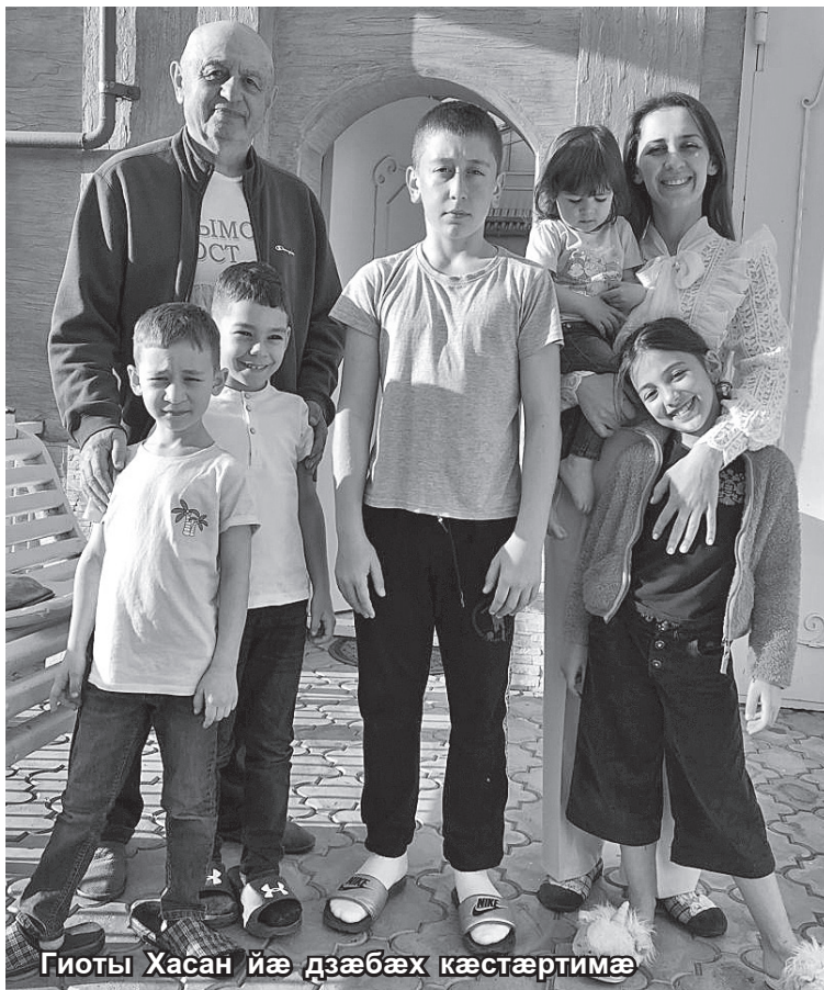
Гиоты Хасан йæ дзæбæх кæстæртимæ

Æнгом бинонты буц хистæр, сыхбæстæ æмæ хъæубæсты йæ уæздандзинадæй хицæн кæны,